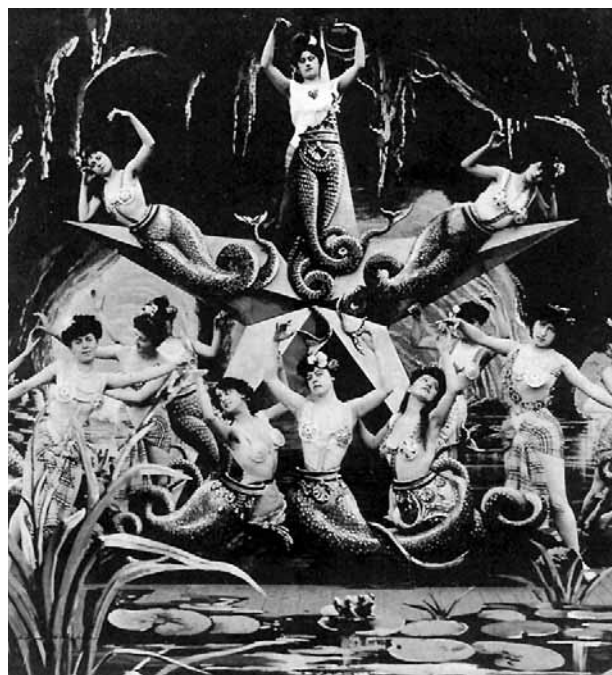
G. Méliès: 20.000 milja pod morem (1906.)

Robert C. Allen i Douglas Gomery objavili su vrlo utjecajnu studiju iz područja metodologije proučavanja povijesti filma. 10 U njoj se zalažu za metodološki pluralizam, a razlučuju nekoliko tradicionalnih pristupa koje, djelomice preformulirane, nastoje objediniti na pojedinim case studies .