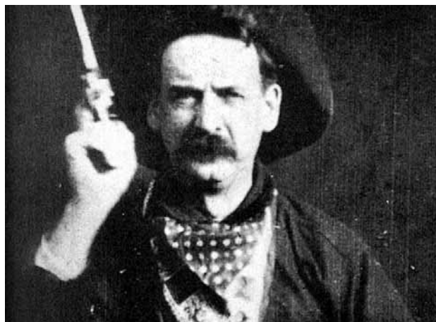
E. Porter: Velika pljačka vlaka (1903.)

i stilskih promjena ili gledateljskih navika, unaprijed se polazi od pretpostavke kako je u filmskom mediju »ugrađena« samoregularajuća komponenta težnje ispunjenju vlastite svrhe. »Čemu uopće tražiti uzroke ako neki film ili pokret sadrži vlastitu unutarnju motivaciju?« pita se Gomery. 2