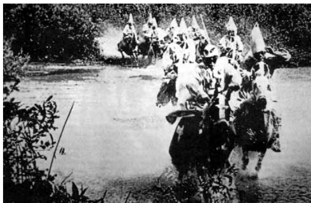
D. W. Griffith: Rođenje nacije (1915.)