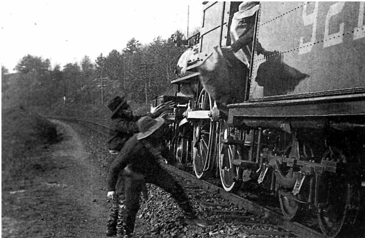
E. Porter: Velika pljačka vlaka (1903.)

filma nisu primjerene kompleksnosti filmskog medija i njegove povijesne recepcije. Povijesti filma pisane su kao pripovijesti s junacima (najčešće redateljima) i negativcima (najčešće producentima), naglim obratima i iznenadnim stilskim i tehničkim »otkrićima«. 1 Kako je to primijetio Douglas Gomery, mnogi povijesni pregledi prepuni su bioloških termina: »rođenje« filma, »očevi« pojedinih filmskih tehnika, »uspon« filmske umjetnosti, njezin »razvoj« i neizbježan »pad«, »dekadencija«. Takav rječnik pomaže pri dramatizaciji i personifikaciji fenomena filma kako bi se zadovoljila uredna kronologija povijesti kao pripovijesti. Osim toga, nastavlja Gomery, u starijim historijama filma prisutan je jako naglašeni ali prešutni teleološki pristup: povijesne se promjene shvaćaju kao »kretanje prema ispunjenju konačne svrhe«. Umjesto pomnog ispitivanja uzroka konkretnih tehnoloških